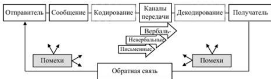
Рис. 38. Структура коммуникации